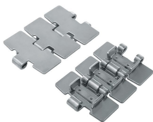
Пластинчатая нержавеющая цепь тип 881 B