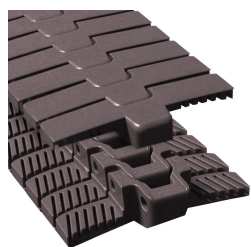
Rexnord TableTop FTLPC 81429723 1050 Side-Flexing Flat Top Conveyor Chain