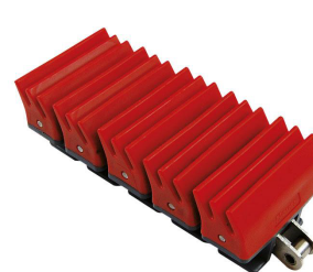
Пластинчатая пластиковая цепь тип 1873 GRIPPER GS1

ВАЖНО!!! Плоские транспортерные цепи поставляются стандартными кусками по 80 дюймов (3,048 метра).